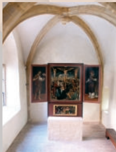
Blick auf den Heinrichsaltar in der Michaeliskapelle