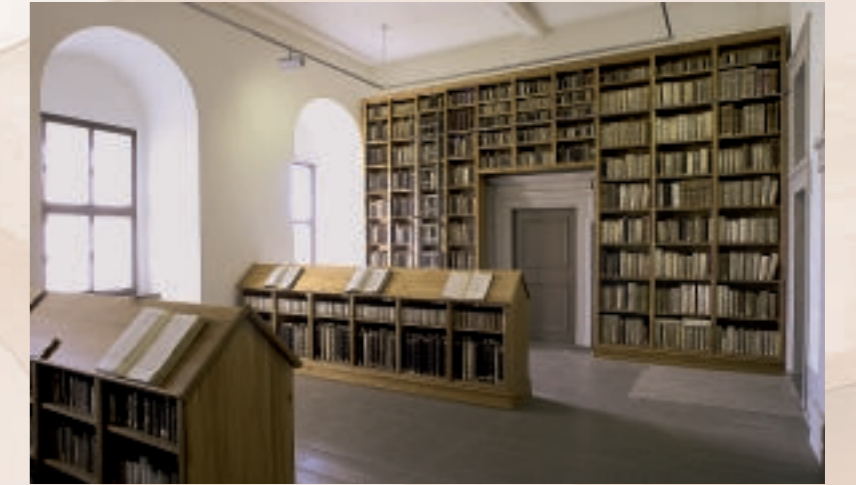
Julius-Pflug-Raum - Stiftsbibliothek Zeitz

Das Bibliotheksgut, welches ungefähr 700 Handschriften und Autographen des 9. bis 18. Jahrhunderts, Fragmente des 5. bis 15. Jahrhunderts, 400 Inkunabeln und 35.000 Drucke des 16. bis 20. Jahrhunderts, an Archivgut weiter rund 400 Urkunden des 12. bis 18. Jahrhunderts und ca. 3000 laufende Meter Verwaltungsschrifttum des 14. bis 20. Jahrhunderts vereint, war seit 1828 u.a. in den Räumlichkeiten des Zeitzer Franziskanerklosters untergebracht. Viele Jahrzehnte waren die Bestände der Öffentlichkeit weitgehend verborgen. Durch ihre Unterbringung in einem brand- und einbruchgefährdeten Gebäude war ihr weiterer Fortbestand akut bedroht.