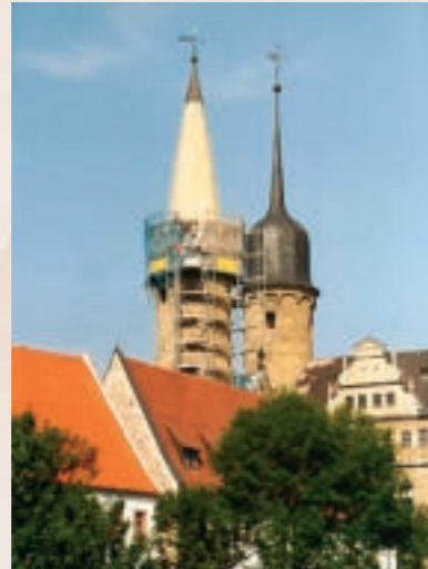
Sanierungsarbeiten am Süd-Ostturm