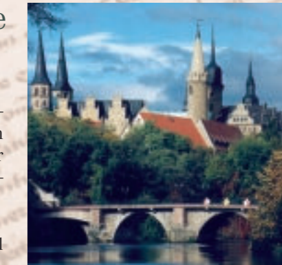
Merseburg Dom und Schloss