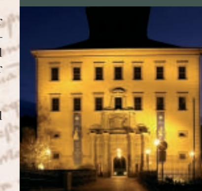
Zeitz Torhaus bei Nacht