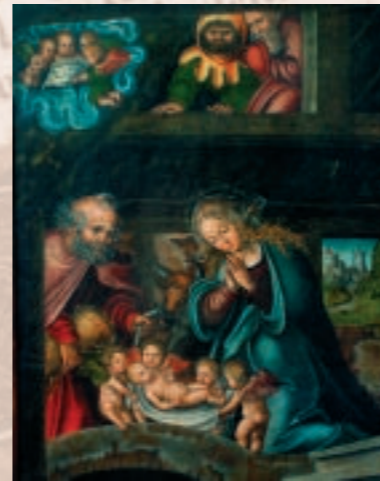
Die Anbetung des Kindes (Meister Grief, um 1520, 75 cm hoch x 58 cm breit)

Das 1965 restaurierte Tafelbild fasziniert den Betrachter durch seine original erhaltene Farbigekeit, die feine Ausführung und die emotional bewegende Darstellung der Weihnachtsszene. Während Josef, der wärmendes Stroh herbeiträgt und sich auf eine einfache Krücke stützt, seinen Blick gedankenschwer auf den Betrachter lenkt, beugt sich Maria andächtig und zugleich Schutz spendend über das von vier Engeln auf einem Tuch getragene Christuskind. Im Bildhintergrund fällt der Blick durch ein geöffnetes Fenster auf eine nahegelegene Burg. Die zwischen Maria und Josef dargestellten Ochs und Esel sind nicht die einzigen Beobachter der Szenerie: über ihnen drängen sich zwei herbeigeeilte Hirten. Rechts von diesen preist ein um ein Notenblatt versammelter vierköpfiger Engelschor den neugeborenen Heiland. Auf dem Notenblatt ist der Anfang von „Gloria in excelsis Deo“ zu erkennen sowie auf der untersten